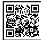
프로그램 신청 QR